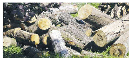
Der Rohstoff Holz soll in der Umgebung geschätzt werden.

Dem Verein ist die Vernetzung der Wertschöpfungskette Holz in ihrer Gesamtheit im Raum Regensburg und ihre transparente Darstellung für die Allgemeinheit wichtig. Dabei geht es um die Förderung der Verwendung und Verarbeitung, ein-