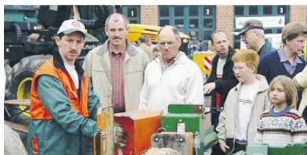
Bei praktischen Vorführungen wird den Besuchern der Umgang mit Holz gezeigt.